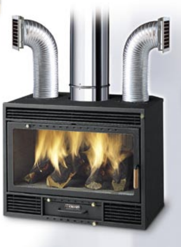
COD. KIFFA73 - King 73 Frontale forzato

Dotato di sistema CCS: Chimney Control System