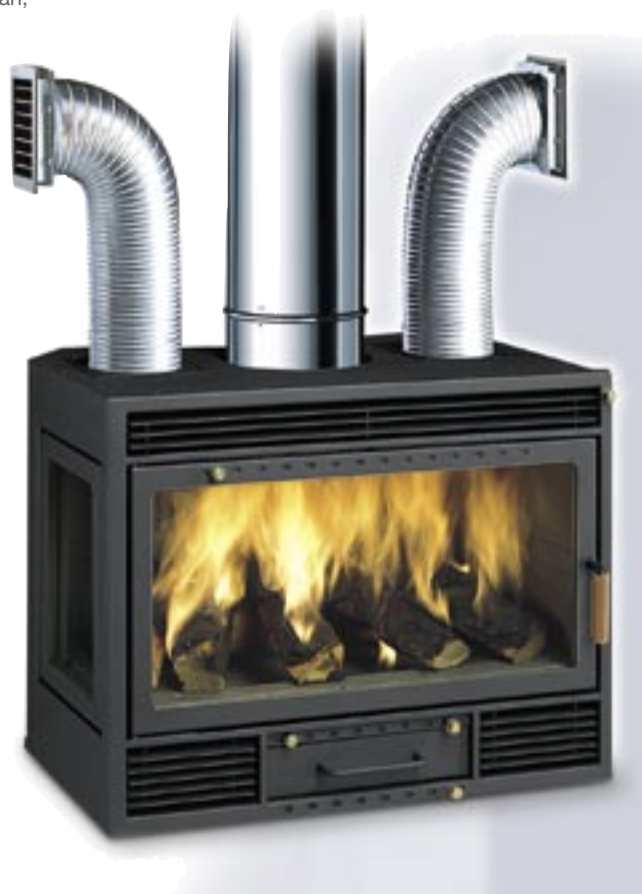
COD. KIDFA73 - King 73 Destro Forzato

Completo di 2 raccordi flangiati per eventuale canalizzazione dell'aria, 1 bocchetta orientabile per la ventilazione della cappa, cm 33,5 x 90; una confezione di sigillante per alte temperature. Nella versione a ventilazione forzata: 2 elettroventilatori da 120 m 3 /h cadauno, con centralina elettronica di controllo dotata di sonda termica.